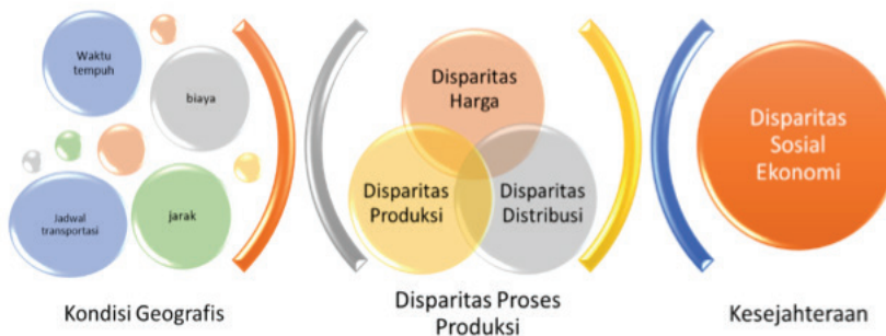
Gambar 1. Identifikasi Masalah Pemerataan Ekonomi di Provinsi Kepulauan

Salah satu langkah yang telah ditempuh oleh pemerintah adalah program tol laut. Namun, program ini belum optimal karena tol laut baru menjangkau pusat-pusat ekonomi, umumnya berupa pelabuhan besar, di Provinsi Kepulauan. Ketimpangan akan semakin terasa karena bagian lain provinsi kepulauan belum terjangkau oleh program tol laut sehingga disparitas masih tetap terasa. Selain itu, adanya tol laut belum secara optimal meningkatkan pertumbuhan ekonomi, karena kapal hanya mengangkut barang konsumsi (dan sedikit